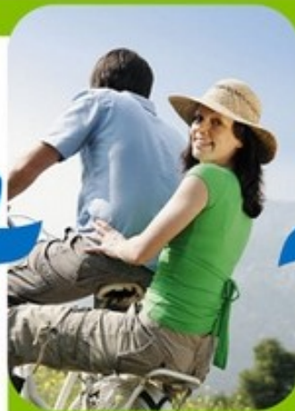
Активный образ жизни